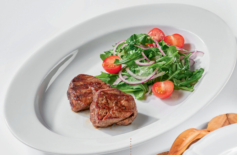
Медальоны из говяжьей вырезки с салатом