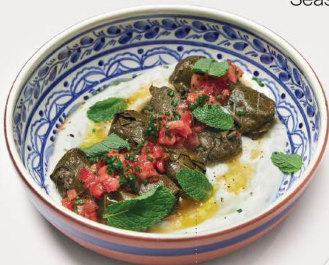
Долма с соусом дзадзики